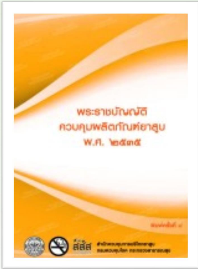
พระราชบัญญัติควบคุมผลิตภัณฑ์ ยาสูบ พ.ศ. ๒๕๓๕